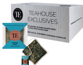
Abbildung / Picture