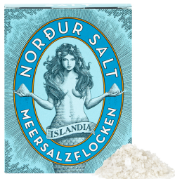
Abbildung / Picture