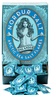
Abbildung / Picture