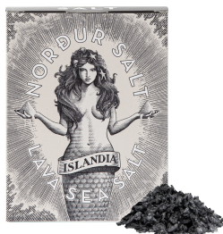
Abbildung / Picture