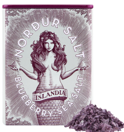
Abbildung / Picture