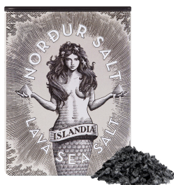
Abbildung / Picture