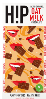
Abbildung / Picture